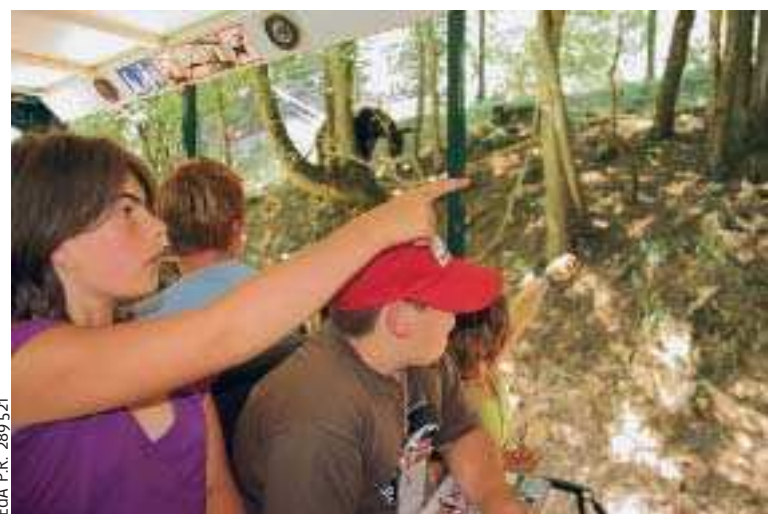
EdA P.R. 289 521