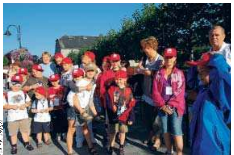
EdA P.R. 289 522